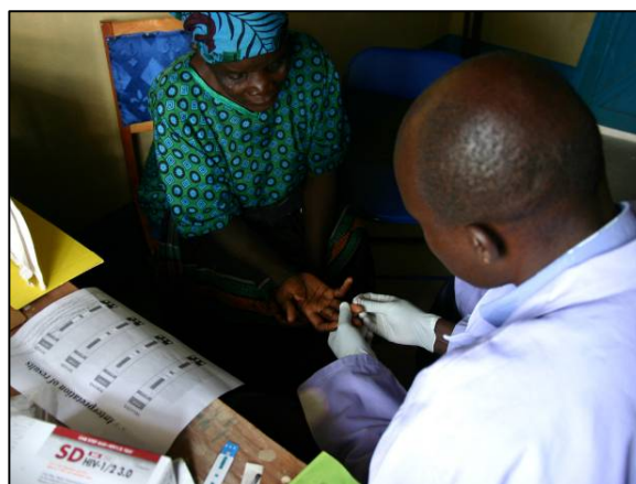
Fig. 1 : un consulente VCT fa il test per l'HIV