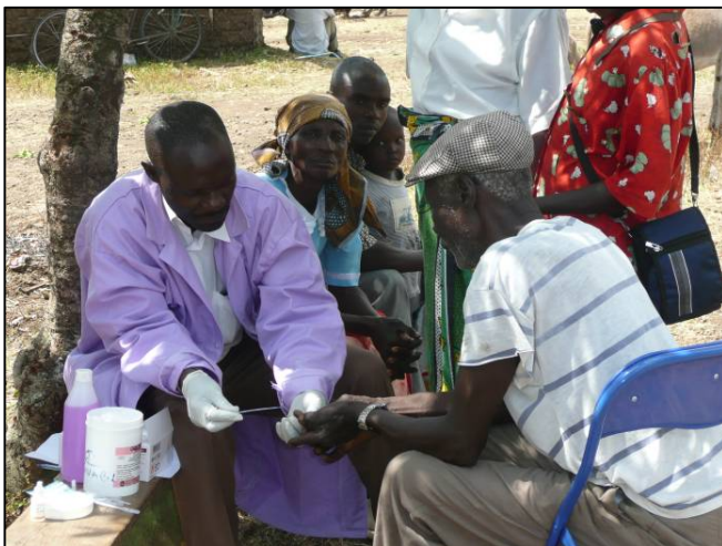
Fig. 2. : mobile clinic