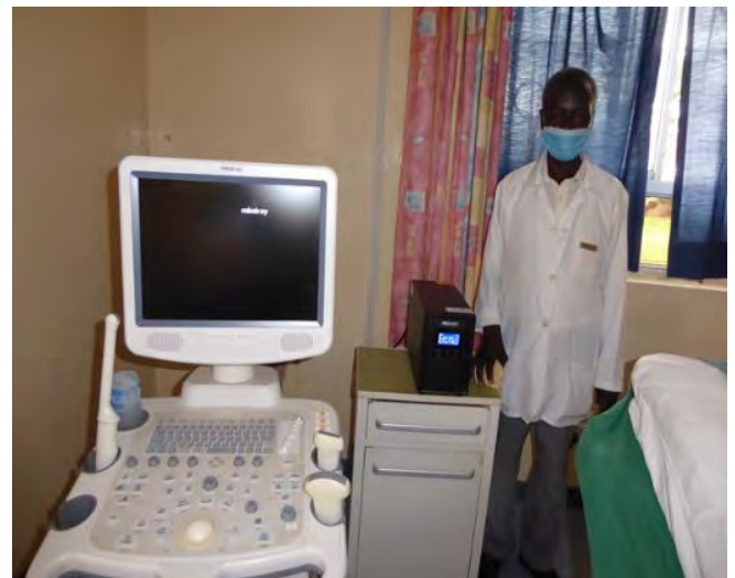
Stampante e fotocopiatrice digitale