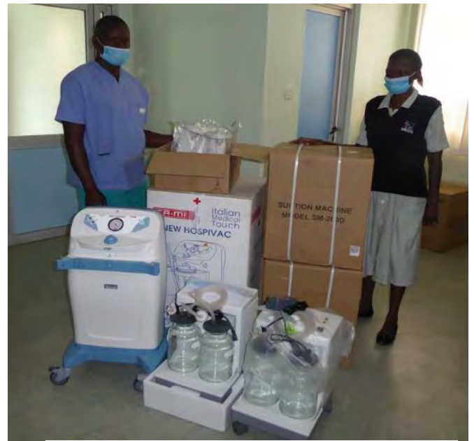
Aspiratori per Sale Operatorie e reparti