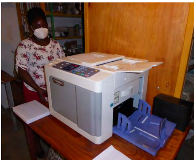
Stampante e fotocopiatrice digitale