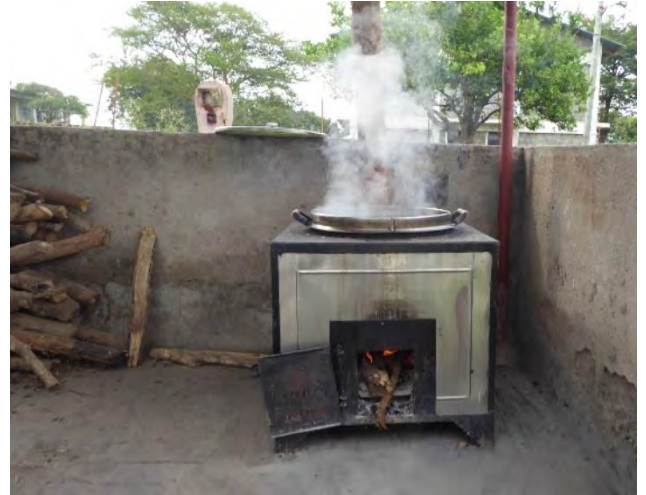
Stufa a legna per cucinare all'esterno