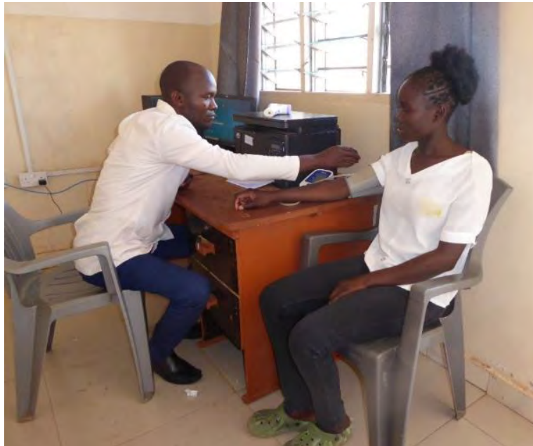
Il clinical officer visita la paziente al dispensario