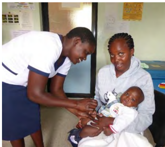
Le madri con i bambini alla Clinica del St. Camillus M. Hospital per vaccinazione antimalaria