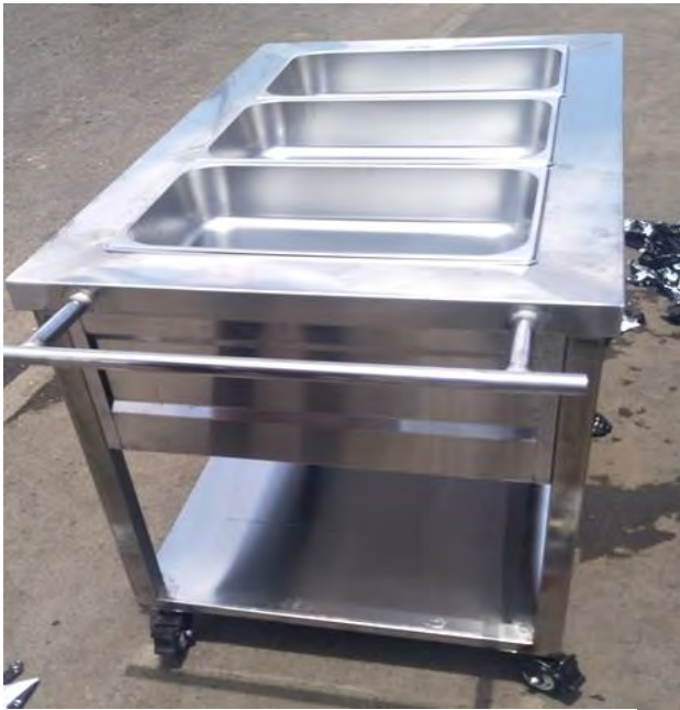
Carello per la distribuzione del cibo