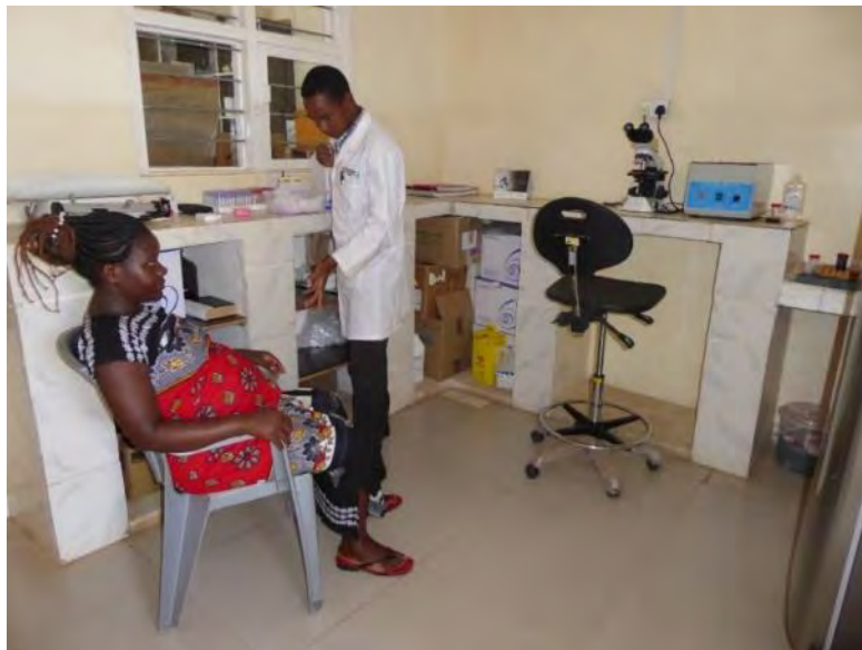
Il tecnico di laboratorio esegui il test alla paziente