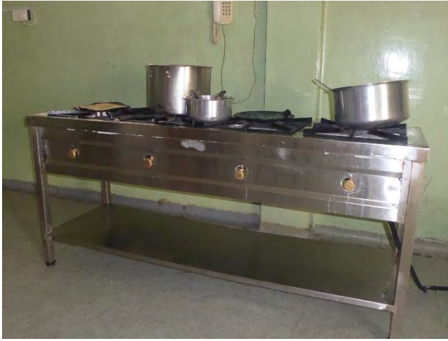
4 fornelli a gas per cucina