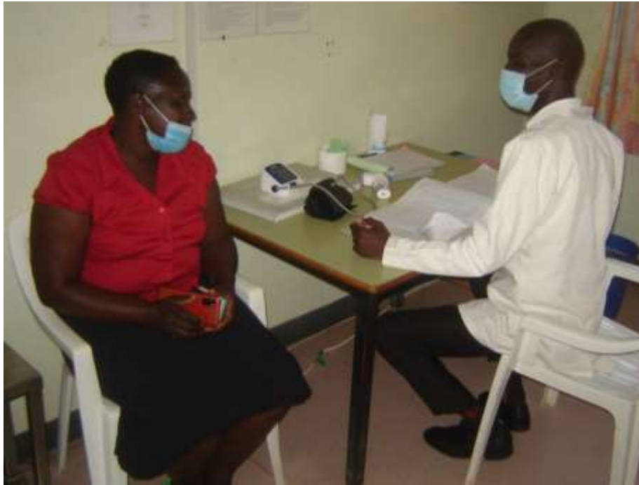
Un operatore addetto allo screening si occupa di un paziente per il test HIV